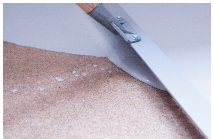
Tirer le béton lissé avec la règle afin qu'ait la même épaisseur partout.