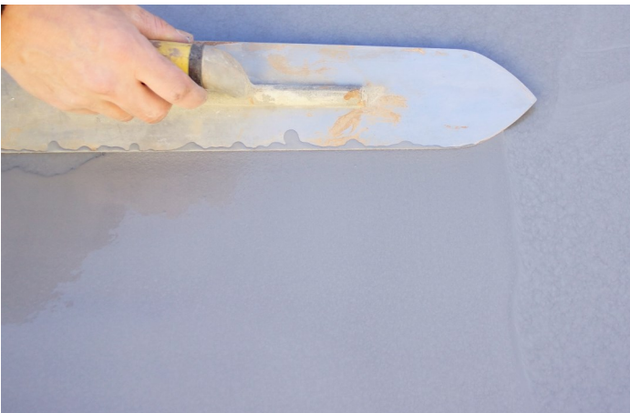
S'aider de la flamande pour mettre en place contre les murs