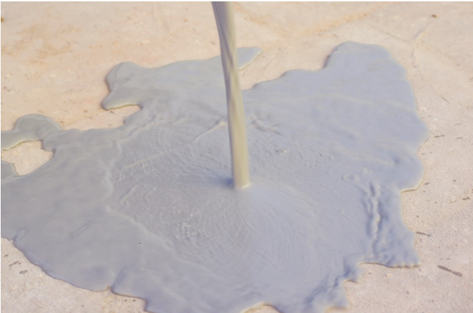
Verser le bl au sol de façon régulière et uniforme.