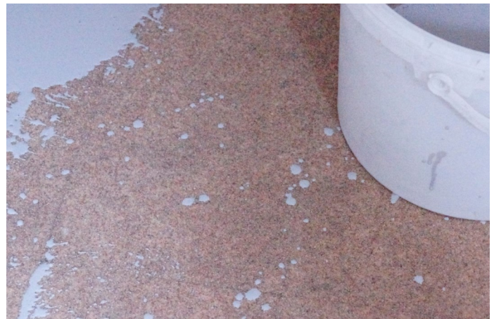
Attention aux gouttes. Prévoir un seau pour poser la flamande dedans et éviter les gouttes au sol.