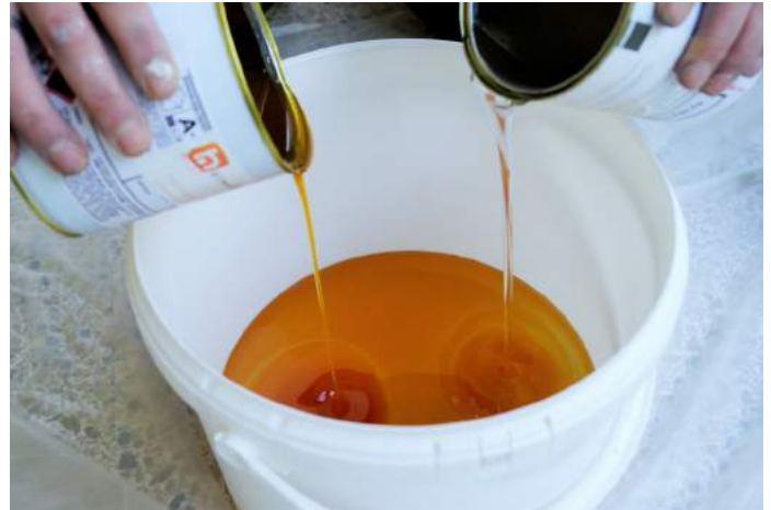
Verser les 2 composants A et B dans un seau propre.