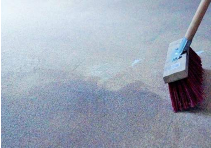
24 h minimum après, balayer le sol.