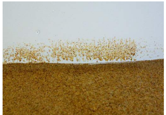
Attention aux murs si la bande périphérique n'a pas été posée avant..