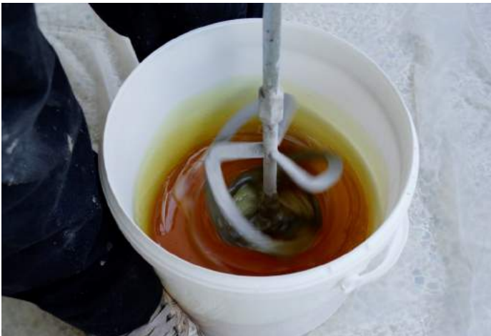
Malaxer à vitesse lente pendant 2 mns.