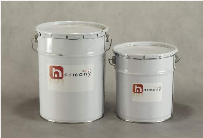
La Prim époxy est une colle à 2 composants.