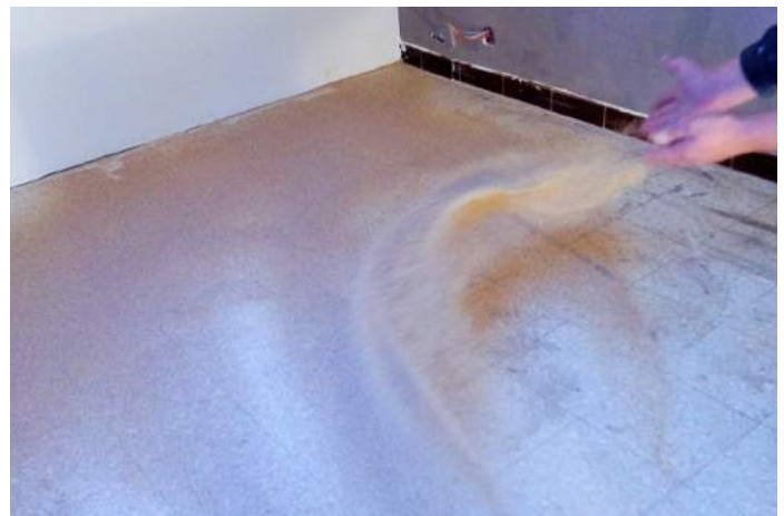
Sabler à refus à l'aide d'Harmony sable au fur et à mesure.