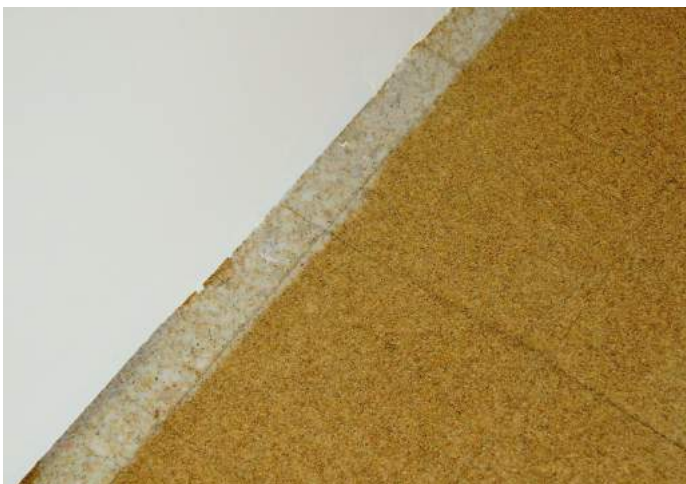
Ne pas oublier de bien aller contre les murs avec la résine avec l'époxy.