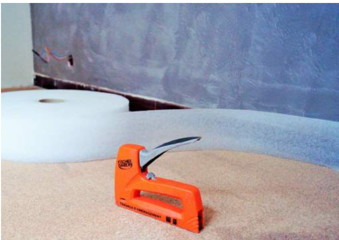
La bande périphérique permet de protéger les murs et de désolidariser le mur du sol.