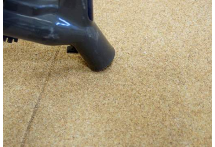
Aspirer pour finir.