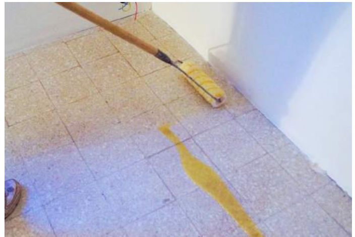
Appliquer la résine époxy à l'aide d'un rouleau à poil moyen. Travailler par bande de 1 m en n'oubliant aucune partie du carrelage.