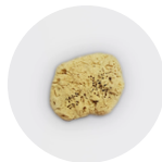
Eponge de mer