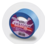
Scotch de protection