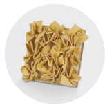
Tampon déco patine