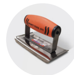
Fer à bordure