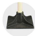
Jeu de moules

Nettoyage des outils à l'eau après utilisation.