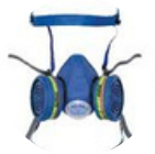
Masque de protection