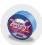
Scotch de protection