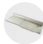
Bâche de protection

Nettoyage des outils à l'eau après utilisation.