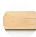
Bois 1 seul morceau