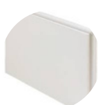
Plâtre et dérivés