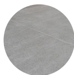
Chape en béton