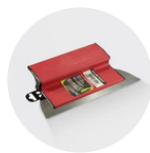
Lame à lisser