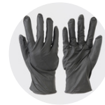
Gants de protection