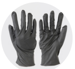
Gants de protection