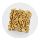
Tampon déco patine