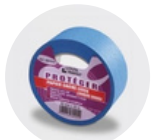
Scotch de protection