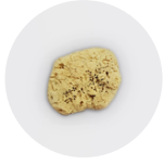
Eponge de mer