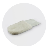
Gant pour patine