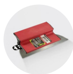
Lame à lisser