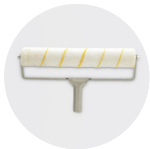
Rouleau pour vernis