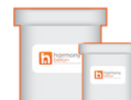
ISY Béton ciré